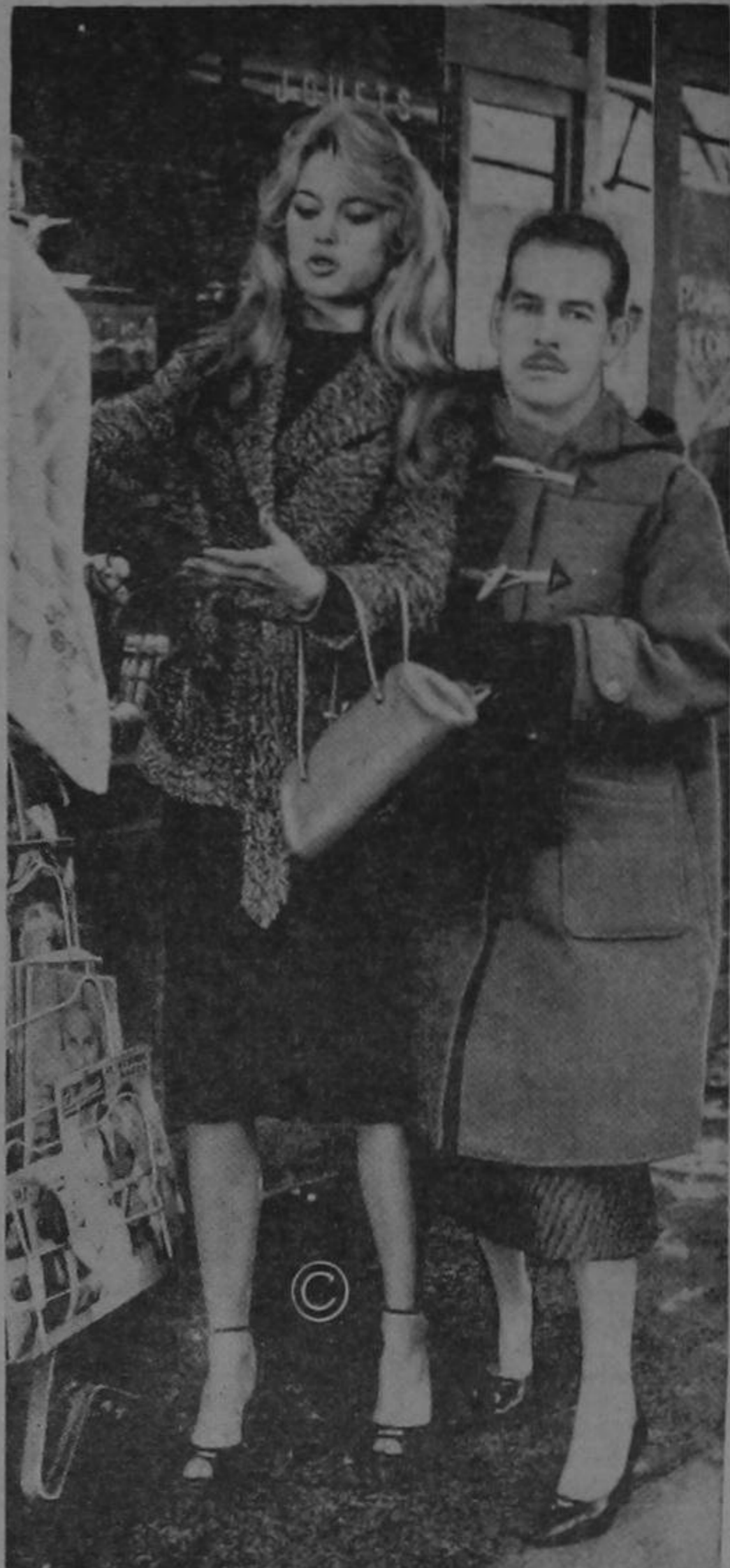
Dicen los cables que la famosa artista Brigitte Bardot se envenenó.